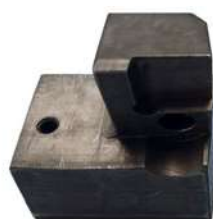
Ohne Forma Shine 100

Vor allem bei hartnäckigen Verschmutzungen wie Vercrackungen und Bremsstäuben sorgt Forma Shine 100 für eine gesteigerte Reinigungsleistung. Als Additiv zu bereits im Einsatz befindlichen Reinigungsprodukten von Bio-Circle ist es einfach zu handhaben.