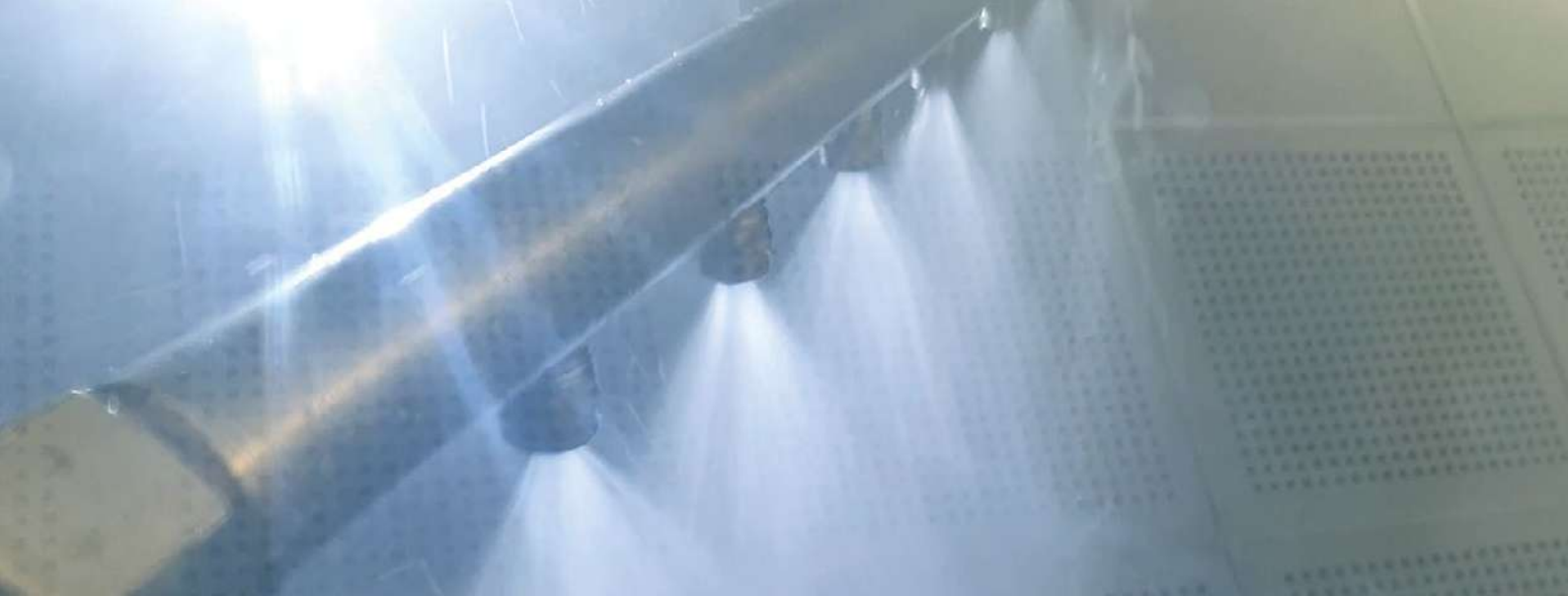
maschinelle Reinigung in der HTW