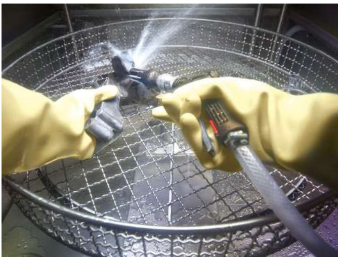
Manuelle und automatische Reinigung im BIO-CIRCLE Turbo

EINSATZBEREICH: Instandhaltung von Bauteilen, Werkstücken und Motoren. Branchenübergreifend: Automotive, Lebensmittel, Metallbearbeitung/CNC, Schienenverkehr, Handwerk.