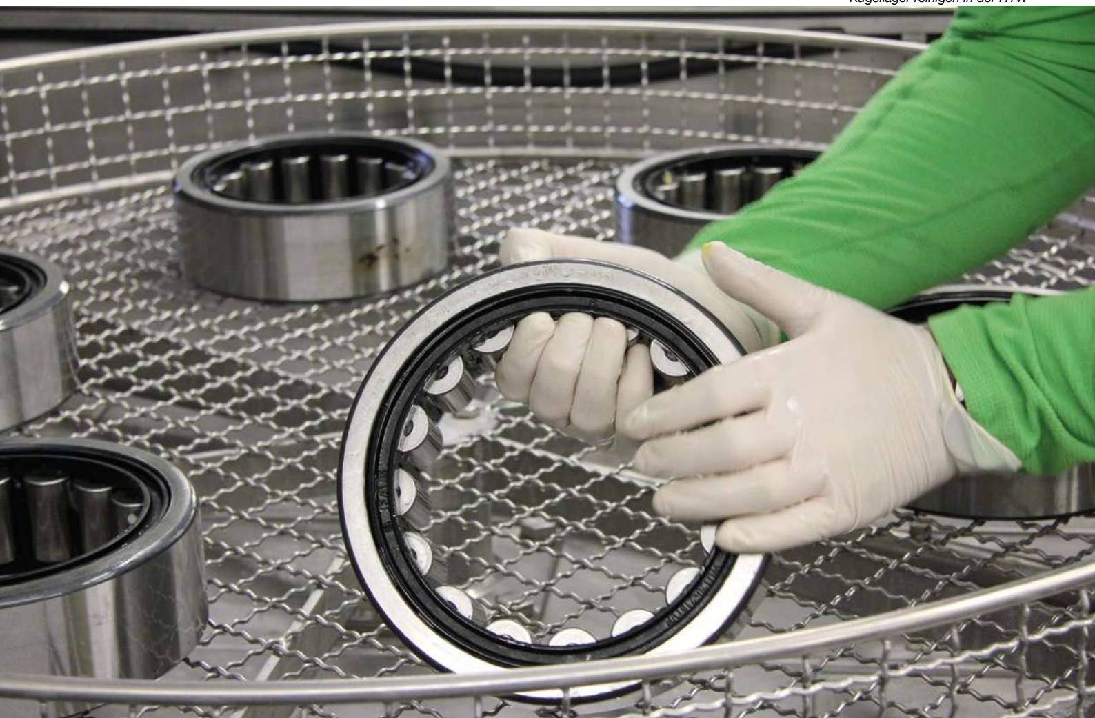
Kugellager reinigen in der HTW

EINSATZBEREICH: Instandhaltung von Maschinen, Universalreiniger für jede Branche