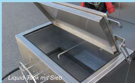
Liquid-Tank mit Sieb