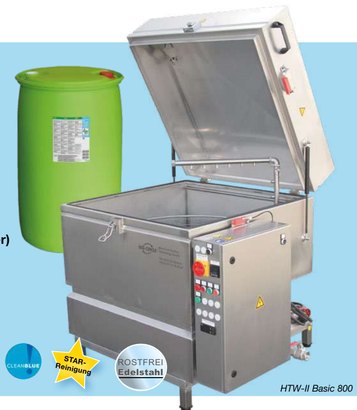
HTW-II Basic 800

Die kundenspezifische Konfiguration der HTW ist kein Problem. (z. B. Erhöhung der Traglast, etc.) Bitte sprechen Sie uns an.