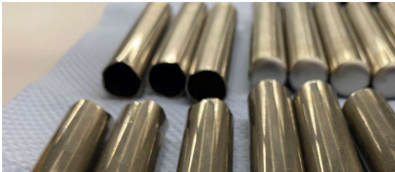
Maschinenteile reinigen mit STAR 100