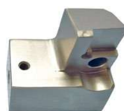
Mit Forma Shine 100