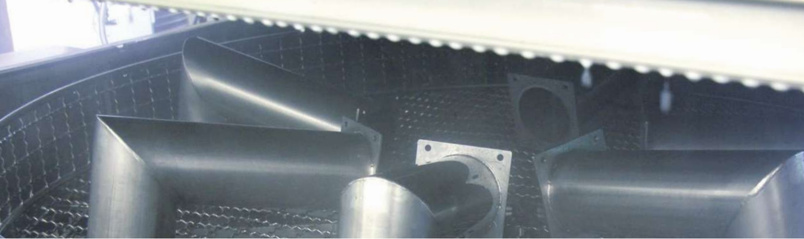
Maschinenteile reinigen mit ALUSTAR 500 in der HTW