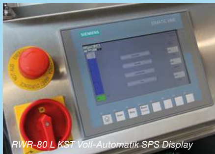
RWR-80 L KST Voll-Automatik SPS Display

Korrosionsschutz für wässrige Systeme Schaumarm, auf Aminbasis, optimal für Stahl-, Eisen- und Gusswerkstoffe. Anwendung NACH dem Reinigungsvorgang: Korrosionsschutz mit Wasser mischen und die Maschine spülen. 23