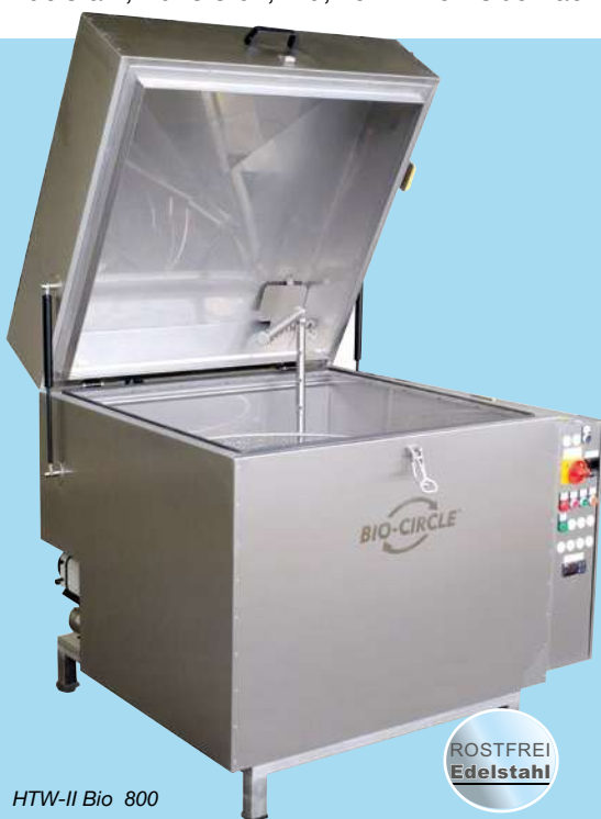
HTW-II Bio 800

Die HTW-II Bio hebt sich von allen HTWs hervor, denn sie ist ein echtes Allround-Talent. Sie wird mit dem Reiniger BIO-CIRCLE L Evo betrieben, der perfekt auf die HTW-II Bio abgestimmt ist. Das bedeutet nicht nur sicheres Arbeiten und eine lange Nutzungsdauer, sondern auch die Reinigung mittlerer bis schwerer Verschmutzungen von Materialien wie Stahl, Edelstahl, Kunststoff, Alu, verzinkten Oberflächen und Buntmetallen.