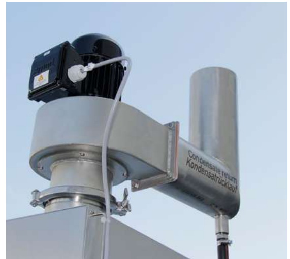
HTW-II – Dampfschwadenabsaugung inkl. Kondensat-Rückgewinnung (BC Turbo und HTW-II Max Eco)