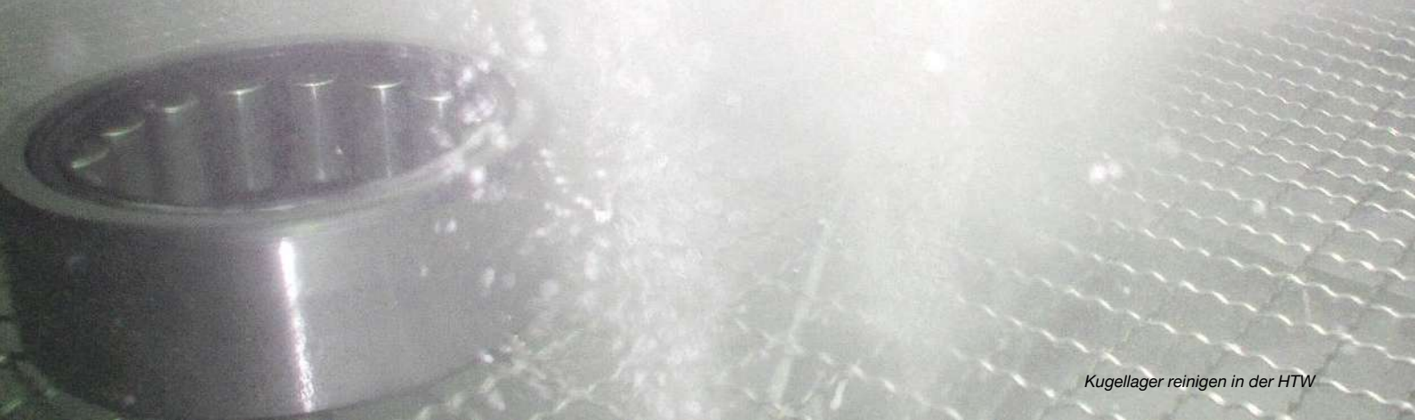
Kugellager reinigen in der HTW