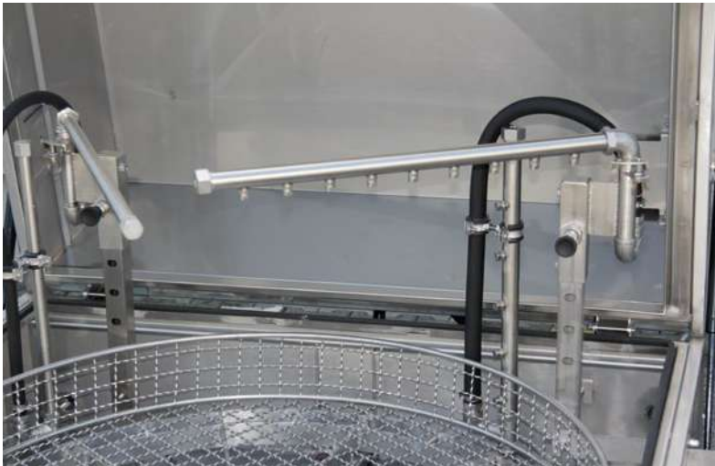
HTW-II Max Eco – höhenverstellbarer Düsenstock für Reinigung und Luftdusche